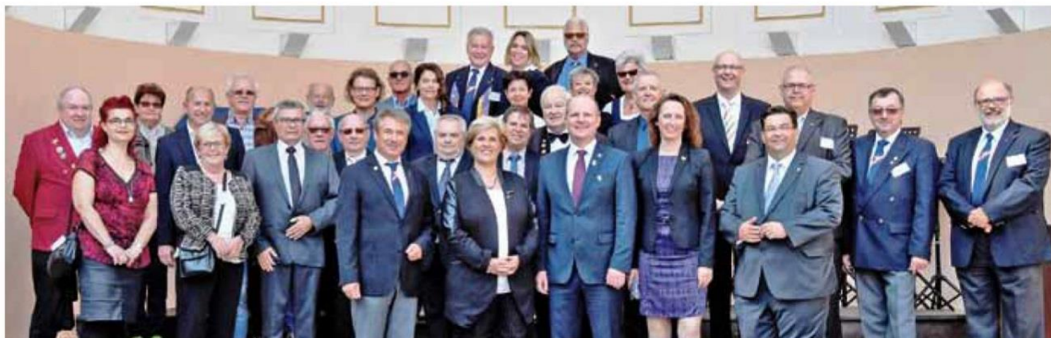
Die Vertreter und Delegierten der Außenbeauftragten-Konferenz der NÄrrischen Europäischen Gemeinschaft.

Erstmals wurde gemeinsam bei einer Weinprobe der Jahreswein der NÄrrischen Europäischen Gemeinschaft verkostet und ausgewählt.